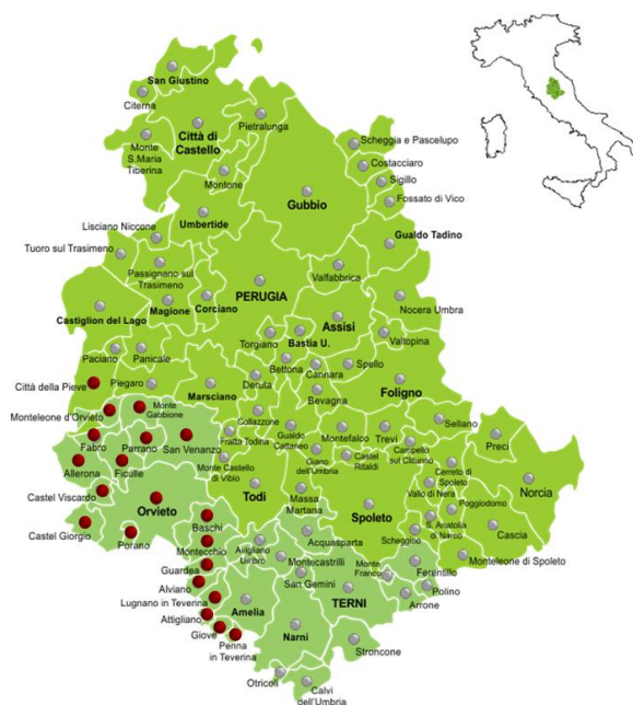
L'area interna Sud Ovest Orvietano e i Comuni interessati

L'area interna dell'orvietano è composta da 20 comuni situati geograficamente a cerniera tra Umbria, Toscana e Lazio, la superficie interessata è pari a 1.187 kmq con una densità della popolazione medio-bassa pari a 52,7 abitanti per Kmq, circa la metà del valore medio regionale pari a 104,5. Il territorio è ricompreso al 100% nelle aree interne.