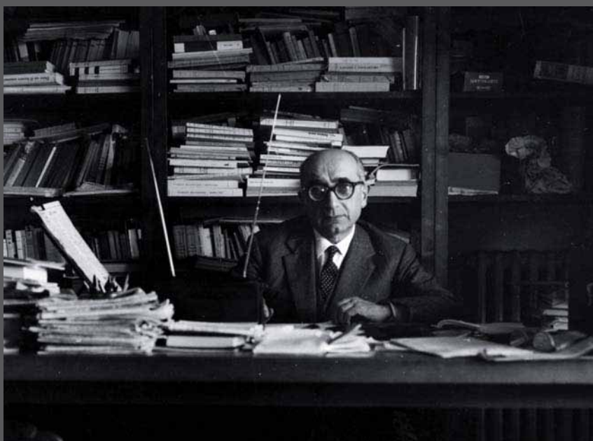
Al tavolo di lavoro negli ultimi anni, tra i suoi libri e le antenne sul mondo