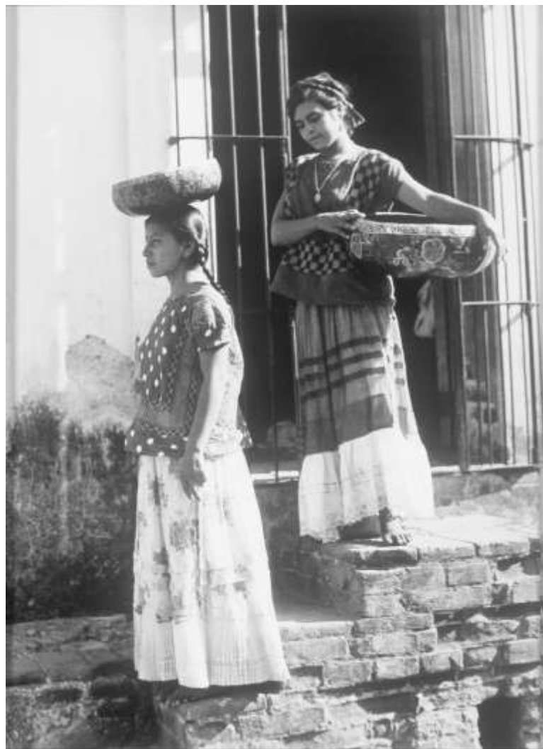
Quando, nel 1926, Weston torna negli Stati Uniti, Tina è già profondamente immersa nel tessuto artistico messicano: il Movimento dei Muralisti la elegge a loro fotografa ufficiale, ritrae spesso le