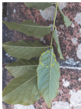
Aleurocanthus su viburno