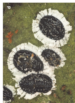
Pupari di Aleurocanthus