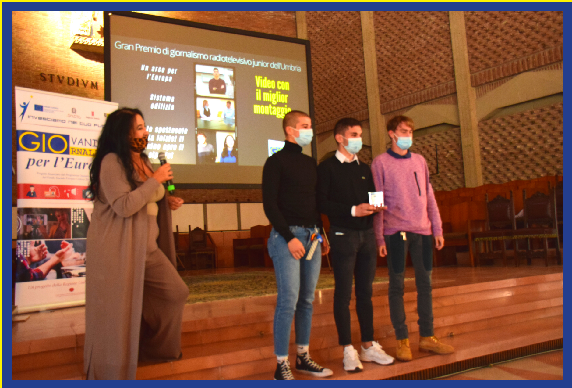
Video con il miglior montaggio: "Un arco per l'Europa" (Itts Volta - Perugia)