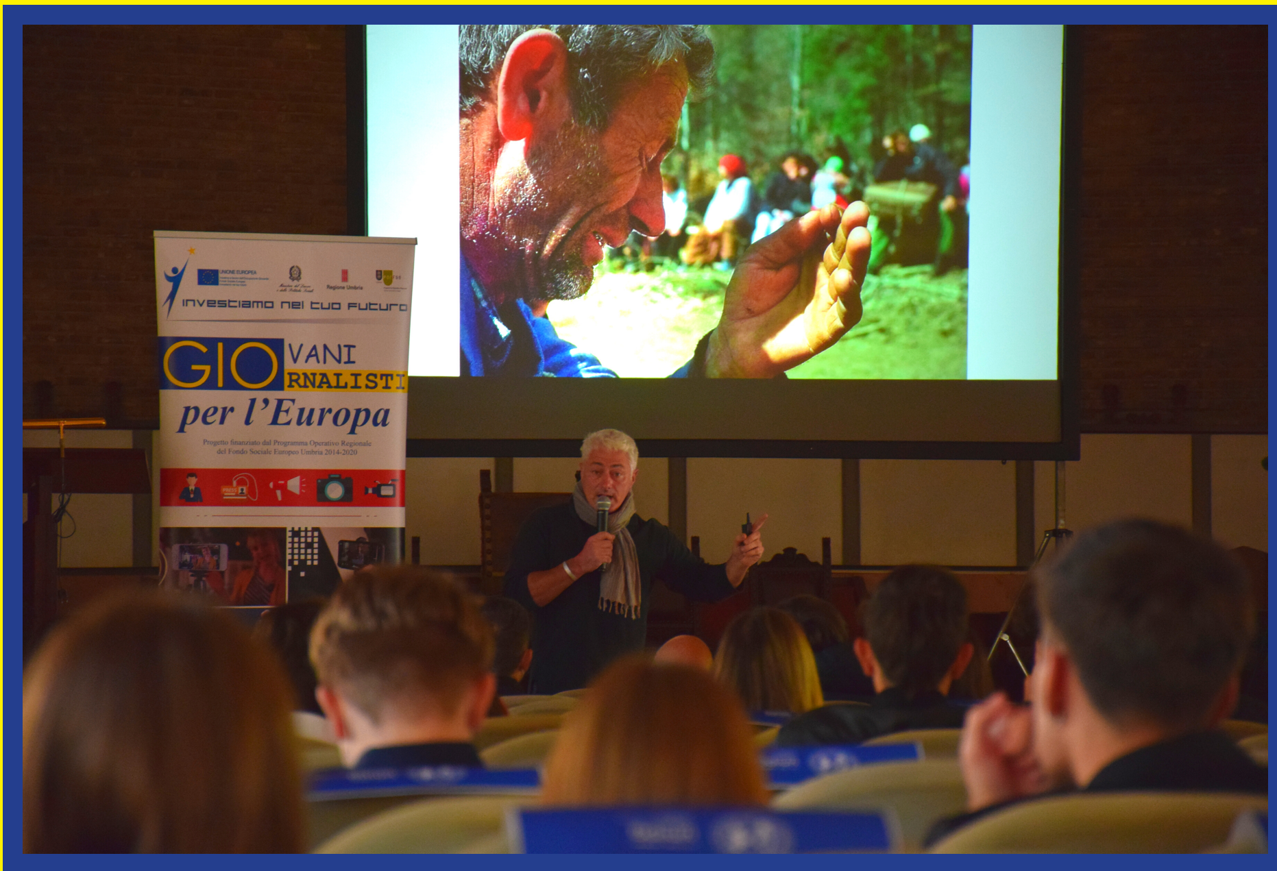
A lezione di "luce" con il fotoreporter Pier Paolo Cito