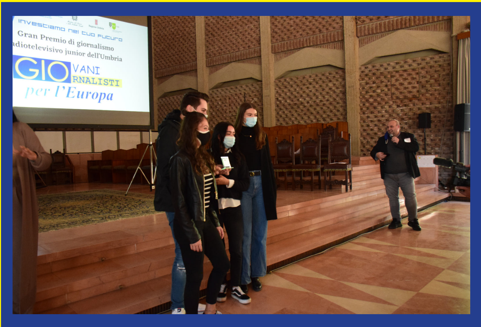
Video con le migliori immagini: "Nessuno rimanga indietro" (Liceo Calvino - Città della Pieve)