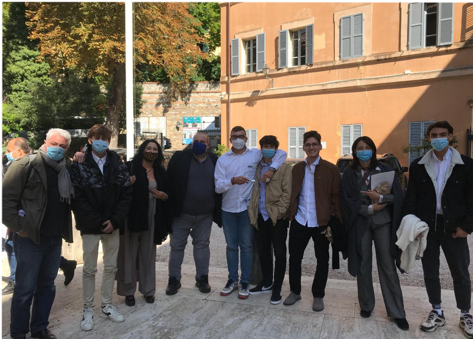
Gli ultimi saluti ai vincitori e si chiude anche la giornata finale