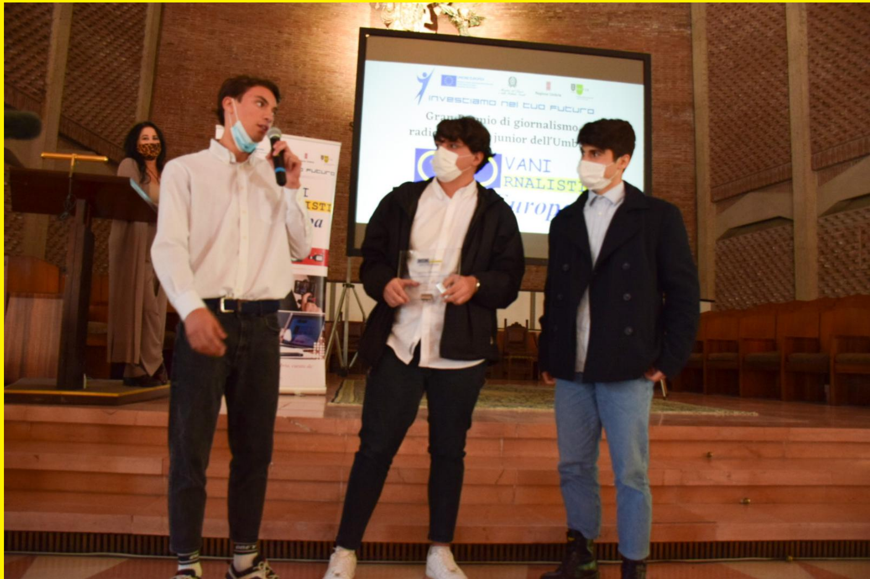
Primo premio - Miglior video secondo la giuria: "Baskin" (Campus da Vinci - Umbertide)