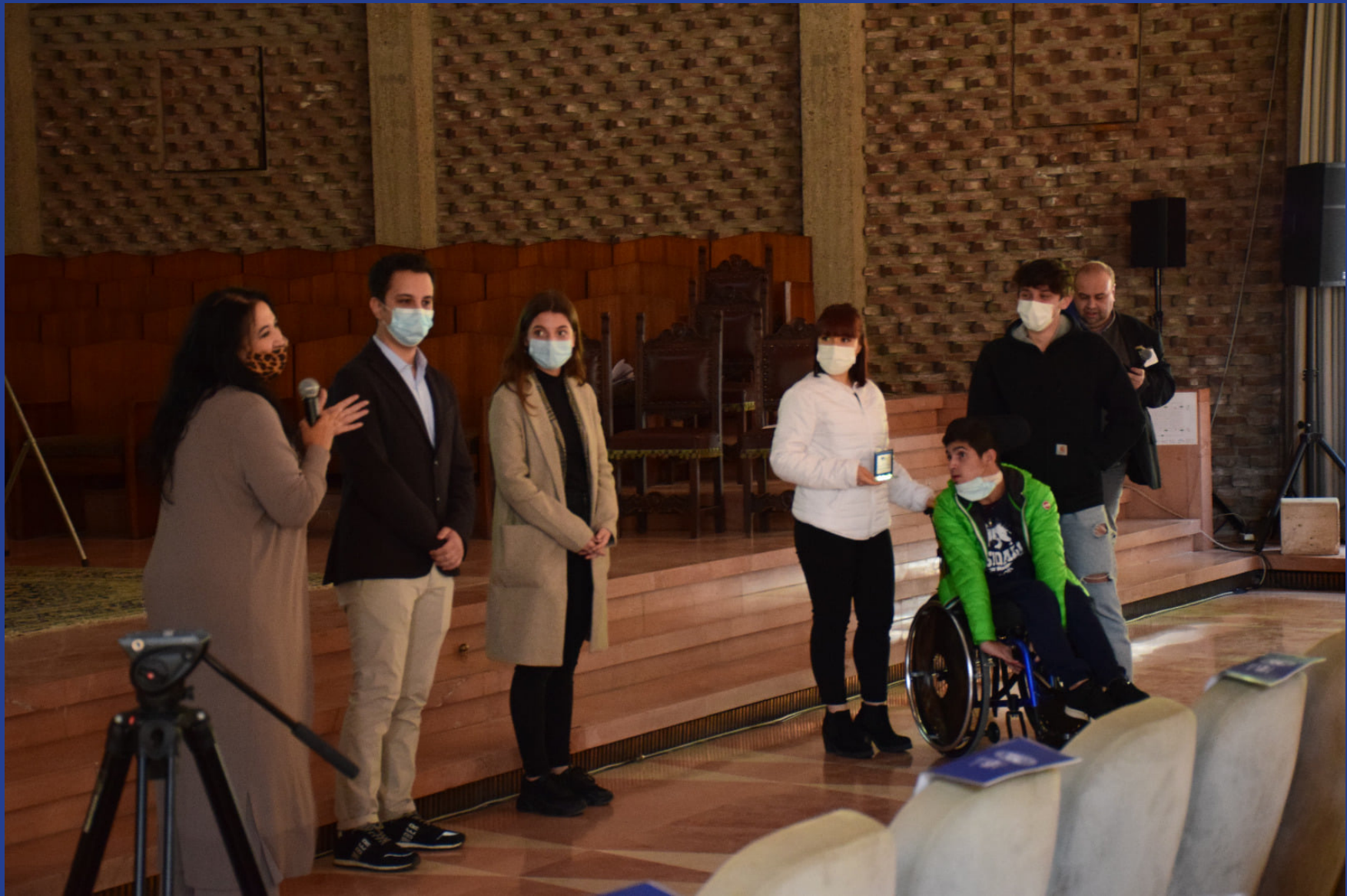
Video scelto da ESN Perugia: "Un viaggio verso l'Unione europea" (Ite Scarpellini - Foligno)