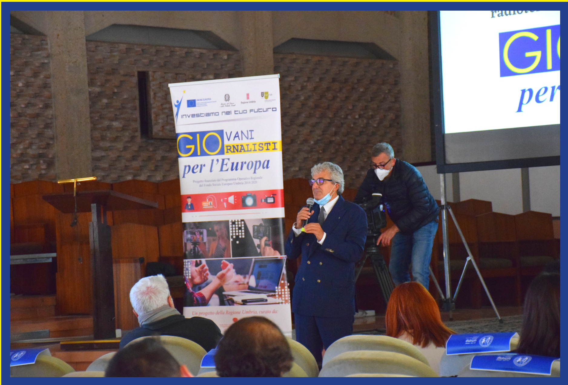
Il saluto del Magnifico Rettore dell'Università di Perugia, Maurizio Oliviero