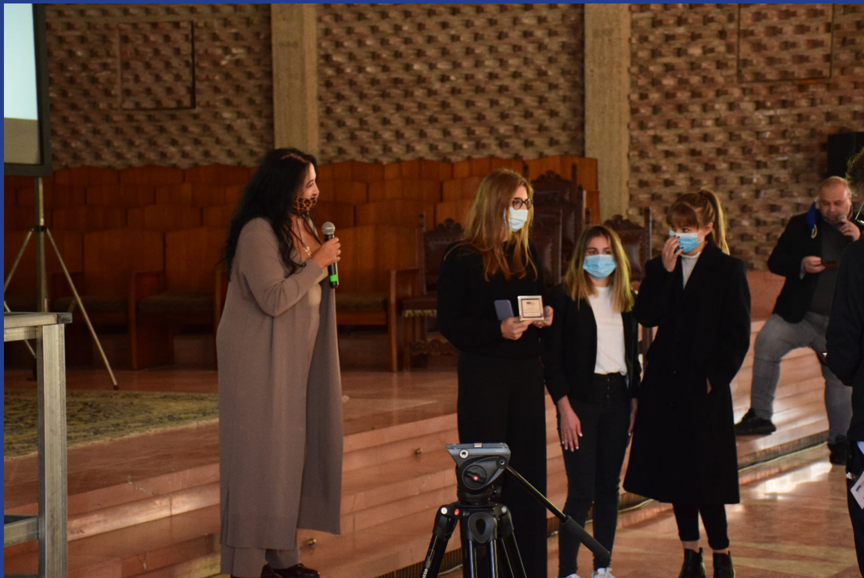
Video con la storia più bella: "L'integrazione nelle diverse sfumature" (Liceo Angeloni - Terni)