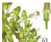
Inizio fioritura - 10% delle caliptré staccate dal ricettacolo.