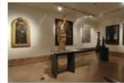
Museo della Porziuncola. Sala espositiva F