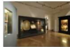
Museo della Porziuncola. Sala espositiva E