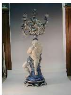
Candelabro Ginori Immagine