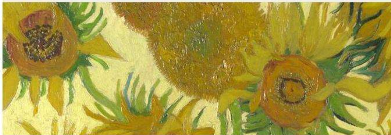
Detail from Vincent van Gogh, 'Sunflowers', 1888

The National Gallery has 2,385 digital images of the collection available to download free for non-commercial use.