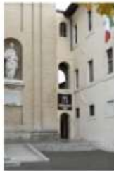
Museo della Porziuncola. Ingresso