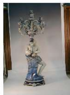
Candelabro Ginori Immagine