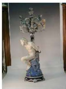
Candelabro Ginori Immagine