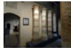
Museo della Porziuncola. Antico chiostro