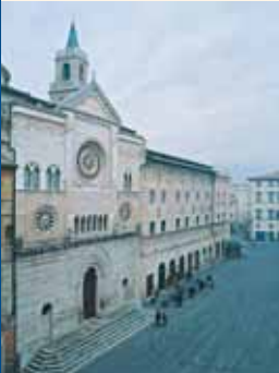
Piazza del Duomo

Civitas Fulginii , nel Medioevo, Fulginium . Scampata agli attacchi dei Longobardi, assalita e saccheggiata dai Saraceni (881) e dagli Ungari (915 e 924), nel XII secolo, grazie alla protezione di Federico Barbarossa, risollevò le proprie sorti divenendo libero comune ghibellino. Agli inizi del Duecento passò sotto il dominio della Chiesa: risalirono a questo periodo l'ampliamento urbano e l'insediamento di attività commerciali e industriali come le cartiere di Pale. Riconquistata nel 1227 da Corrado Guiscardo per conto di Federico II, fu importante centro filoimperiale fino al XIV secolo, allorché fu conquistata dal vicario pontificio Rinaldo Trinci, che nel 1310 ottenne la signoria della città. Sotto il dominio dei Trinci visse una stagione di notevole sviluppo sia territoriale, assoggettando città come Spello, Montefalco, Assisi, Bevagna, Trevi e Nocera, che culturale. Con l'uccisione di Niccolò Trinci nel 1424, ebbe inizio la decadenza della famiglia, definitivamente deposta per opera dell'esercito pontificio nel 1439. Entrata a far parte dei territori provinciali dello Stato Pontificio, Foligno riuscì a conservare un discreto benessere grazie alla fertilità della zona, ottenuta anche attraverso la bonifica della piana. Durante l'invasione napoleonica fece dapprima parte della Repubblica Romana (1799), poi del Regno d'Italia (1809-1814); nel 1860 fu annessa al neonato Stato italiano.