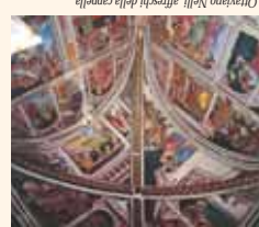
Cristiano Nelli, affresco della cappella

da decorazione raffigurante gli Erri medievale , nella parete opposta, ciclo di affreschi eseguiti al tempo di forse allusiva al giardino della vita, le Sette al 1415. La decorazione della cappella, Personaggi dall'antichità ricorrono nella affrescata da Ottaviano Nelli con Storie et dell'uomo .