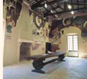
Palazzo Trinci, sala delle Arti liberali e dei Pianeti

nuova biblioteca comunale. Nel frattempo, divenuto dal 1927 proprietà del Comune (a quell'anno risale l'edificazione dello scalone interno, su disegno di Cesare Bazzani), il palazzo venne sottoposto ad una prima campagna di restauri, cui fece seguito una seconda serie di interventi, protrattisi fino al 1950. Il crollo di una parte del tetto nel 1985 ha determinato la chiusura dell'edificio e l'ultima notevole opera di recupero delle strutture e della vasta superficie affrescata. L'origine della pinacoteca risale al 1863, quando, per l'avvenuta soppressione degli ordini religiosi, gli oggetti d'arte dei monasteri e degli ex conventi divennero di proprietà del Comune. Inizialmente raccolti nella chiesa di Bethlehem, dal 1904 vennero trasferiti nel palazzo comunale e solo dal 1936 nella attuale sede.