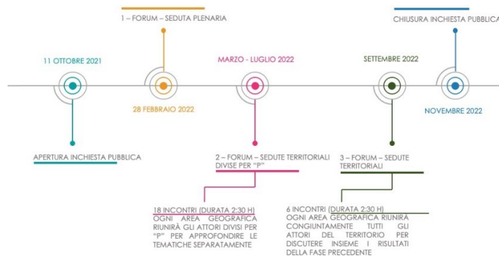
Figura 9 - Timeline del processo