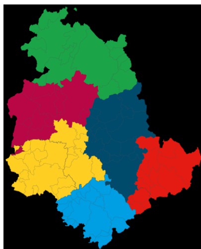
Figura 1 - Aree di Sostenibilità

La suddivisione territoriale risultante, elaborata da FELCOS Umbria e condivisa con la Regione Umbria e ANCI Umbria, è raffigurata nella cartina di seguito riportata.