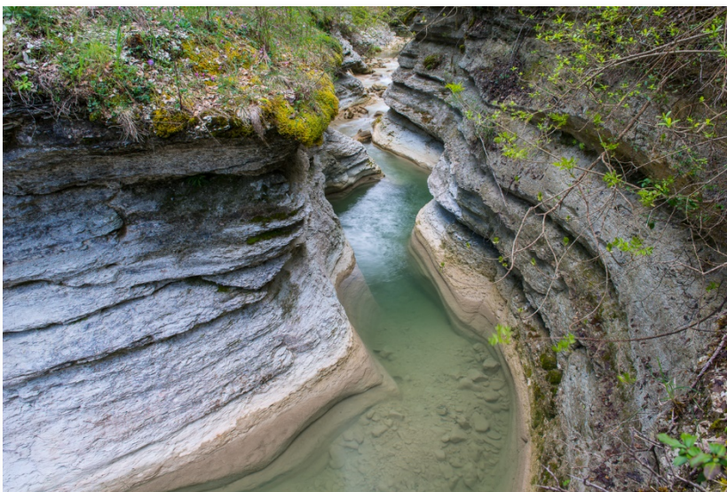
Il torrente Marchetto affluente del Fiume Tescio

La rete idrografica risulta essere poco sviluppata e diversificata lungo due versanti principali, comunque la maggior parte delle acque meteoriche viene assorbita dai calcari cretacei e liassici fortemente fratturati, favorendo il progressivo fenomeno di carsificazione che si osserva nel monte. Nel massiccio del Monte Subasio, tra i fenomeni carsici, sono presenti anche alcune cavità sotterranee, rappresentate da pozzi, grotte e cunicoli. La cavità principale è denominata Grotta del Subasio, ubicata nei pressi di Sasso Piano ad una quota di 1.050 m s.l.m., profonda circa 30 metri; altre cavità minori si aprono in corrispondenza del Fosso delle Carceri, in località Vallonica ed in località Stazzarelli.