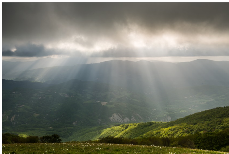
Dai prati sommitali del M.te Subasio verso est

Provvedimento istitutivo: Legge regionale n. 9 del 3 marzo 1995