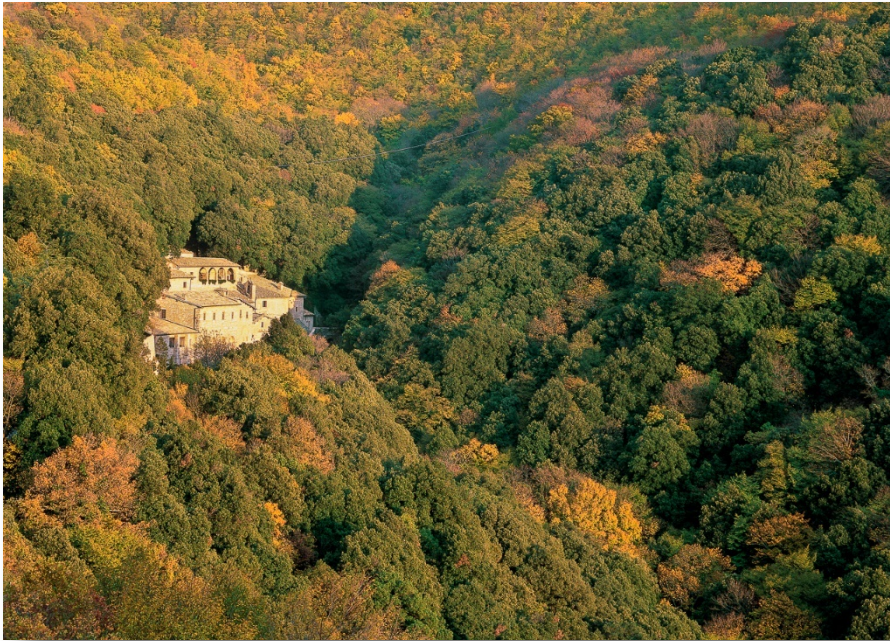
Eremo delle Carceri del Monte Subasio

L'area sommitale occupata dalle praterie, è circondata da zone boscate, ad eccezione del settore sud orientale,