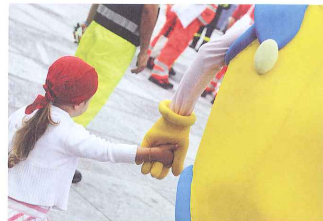
Raduno nazionale della PC a Milano (2009)

tosì in 3D grazie a cartoons d'effetto e 'incarnatosi' come personaggio invitato a tantissimi eventi su e giù per lo 'stivale' e persino superpremiato, adesso la sua strada si arricchisce di un nuovo capitolo.