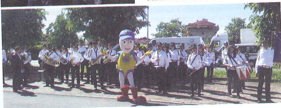
Le recenti apparizioni di Civilino a Charvensod (AO), Paderno Dugnano (MI) e Santa Domenica Talao (CS)

ta Italia - come amplificazione del progetto di Anci Umbria che ha coinvolto qualcosa come 35.000 bambini in tutta la regione, contando su 140 gruppi di volontariato, realtà strategica e fondamentale nell'attuazione del programma - sono migliaia e migliaia ormai gli studenti di tutte le età che in aula hanno avuto un approccio diretto con questo personaggio, protagonista da Perugia a Maratea, da Charvensod in Valle d'Aosta a Lesina, da Viterbo a Santa Domenica Talao (CS), fino a Paderno Dugnano (MI), solo per citare alcune delle manifestazioni a cui ha preso parte la grande mascotte. Dunque la didattica come prevenzione, con il coinvolgimento delle scuole e l'effetto domino sulle famiglie. Sulla scorta di questa esperienza, Civilino diventa il fulcro dell'omonima associa-